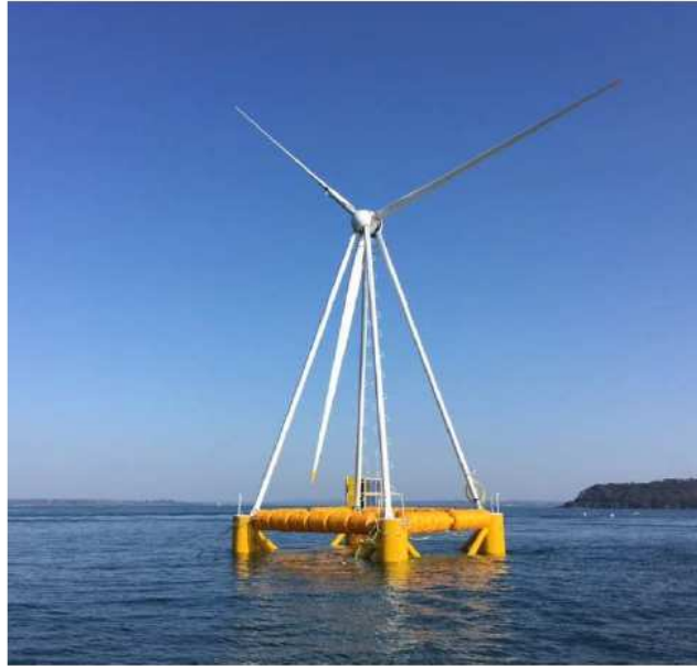
Prototype Eolink 200kW en opération en 2018